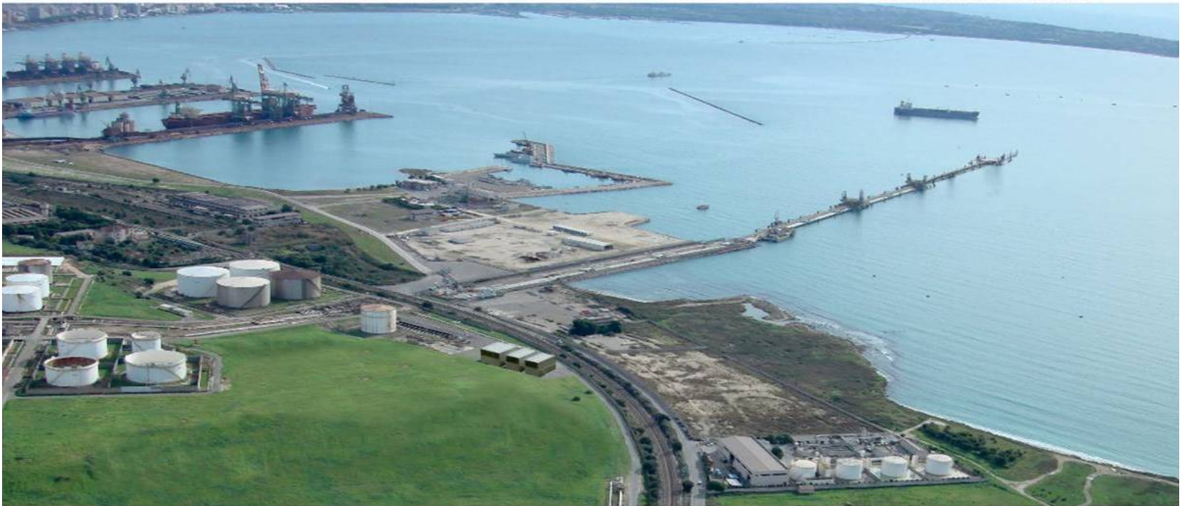
TEMPA ROSSA RENDERING AMPLIAMENTO PONTILE