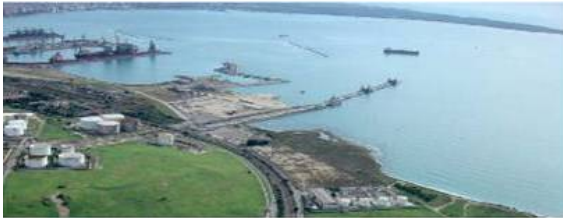
VISTA AEREA STATO DI FATTO